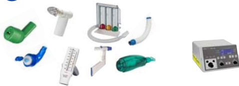
GeloMuc / Flutter / Quake / Cornet / Cornet Plus / Acapella / IPPB Atemtherapie RespiPro / PowerBreathe medic