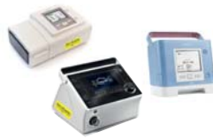
BiPAP A40 Silver Series, Trilogy von Philips Respironics prisma VENT30/40/50-C von LöwensteinMedical