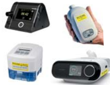
CPAP/autoCPAP/ BiLevel/BiLevel ST/Cheyne Stokes