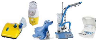
Membran-Vernebler, Ultraschallvernebler, Vernebler mit Schall-Vibration insbesondere für Nasennebenhöhlenentzündung