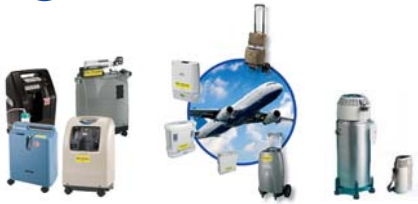
Konzentratoren, stationär + mobil Füllstationen, FlüssigO 2