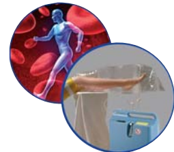
Wundheilung mit Sauerstoff O 2 -TopiCare Wundsystem